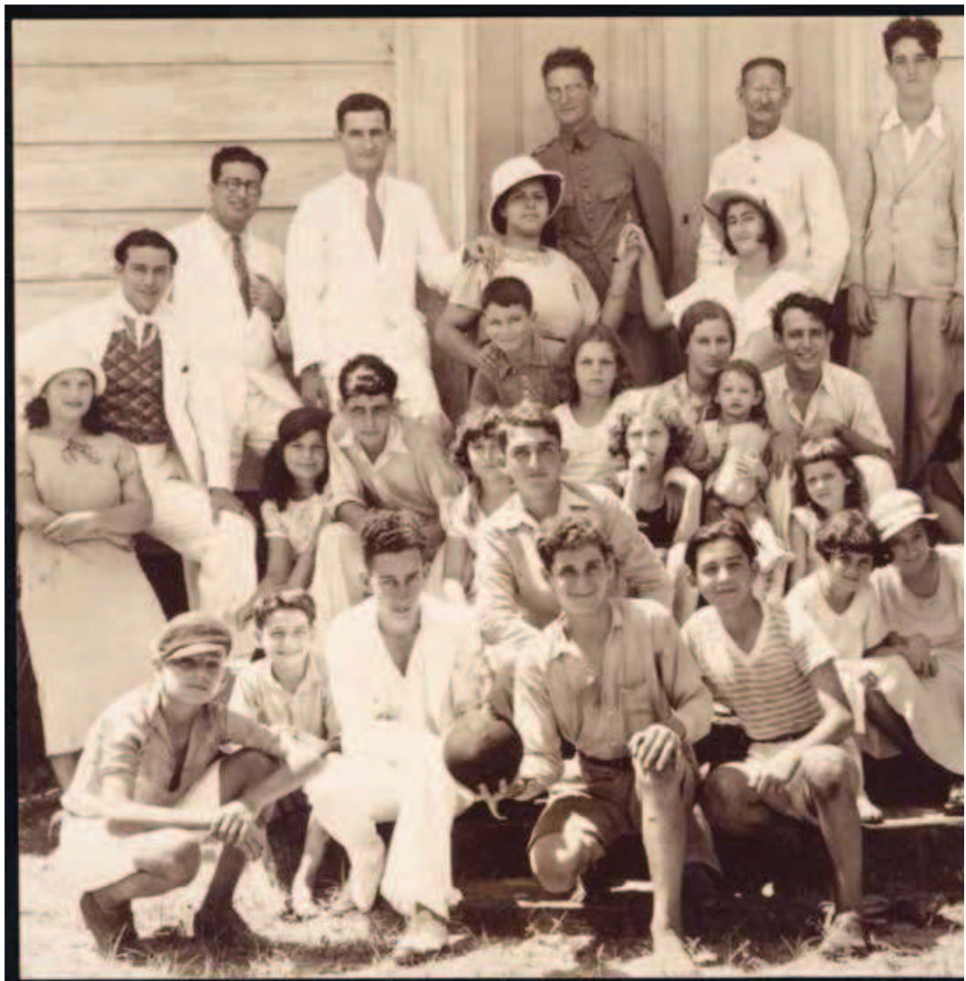
foto: Leden van de jeugdvereniging Tikwath Jisrael, opgericht in Paramaribo (Suriname) in 1933.

De tentoonstelling Joden in de Cariben. Vier eeuwen geschiedenis in Suriname en Curaçao in het Joods Historisch Museum laat de bezoeker kennismaken met de rol die de Portugese Joden hebben gespeeld in de voormalige overzeese gebieden van Nederland in de West, inclusief hun aandeel in de slavenhandel.