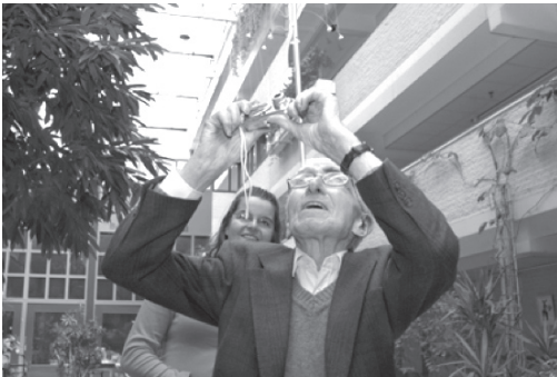
Activiteitenbegeleider en oudere.

In het Joods verzorgingshuis Beth Shalom, in Amsterdam Buitenveldert hebben we een ID-project voor ouderen uitgevoerd. Het ging om een proefproject voor verzorgingshuizen, maar is in principe met elke groep ouderen te doen. Het project droeg de naam ‘Levenslessen van ouderen’. Daarin maakten vijftien ouderen tussen de 76 en 93 jaar in woord en beeld hun levensportret. Met behulp van pen, papier, digitale camera en scanner ontstonden fotoalbums en visuele beelden op tentoongestelde panelen.